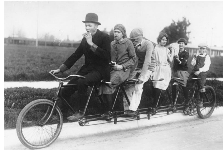
Bild 103-R13088 1925 ca.

Ziel: Qualifizierung in Regelausbildungen gegenseitige Unterstützung und Förderung