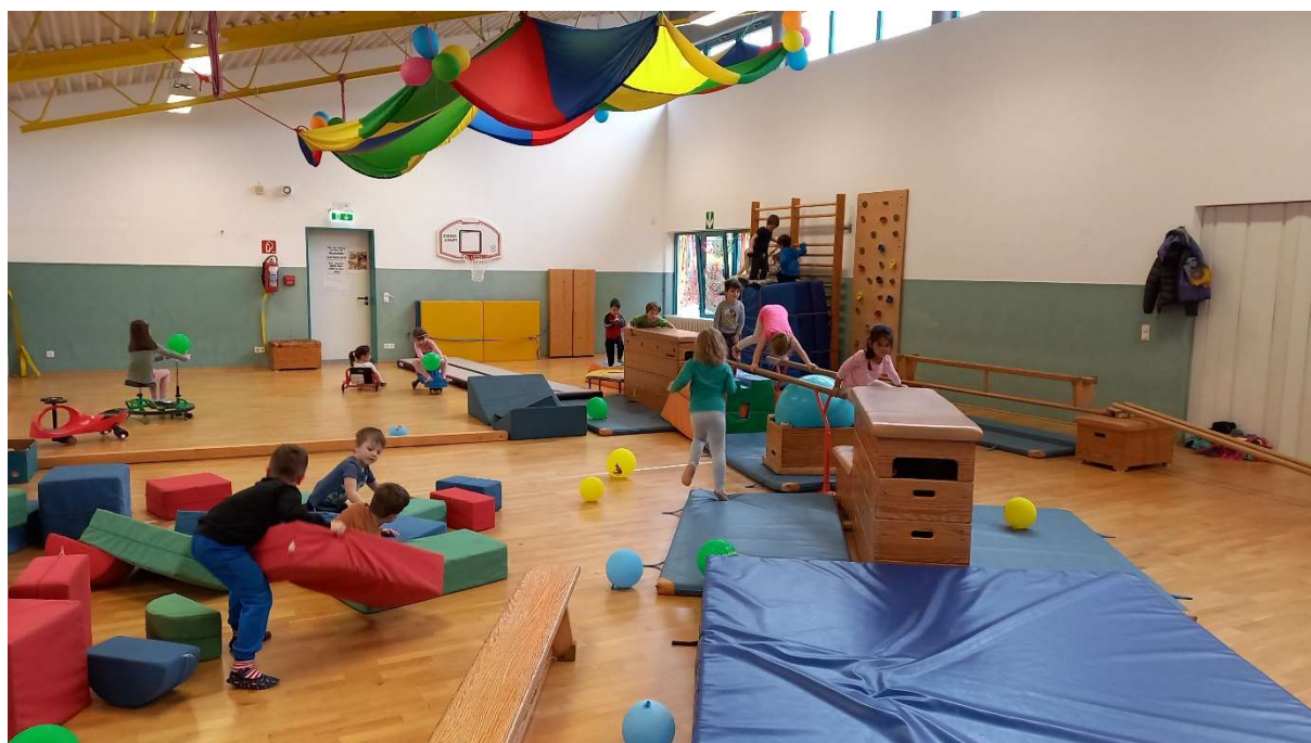
Abbildung 3: Aufbau der Halle