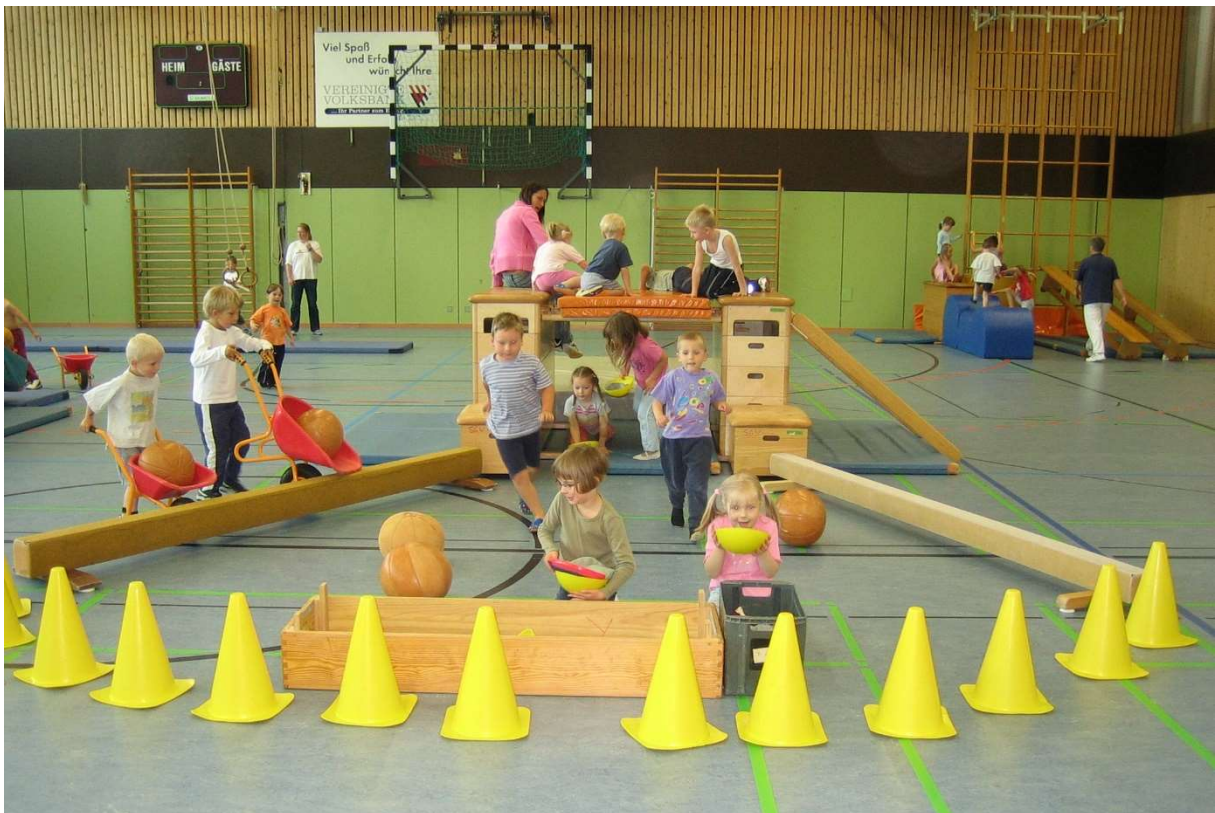
Abbildung 5 Große Halle