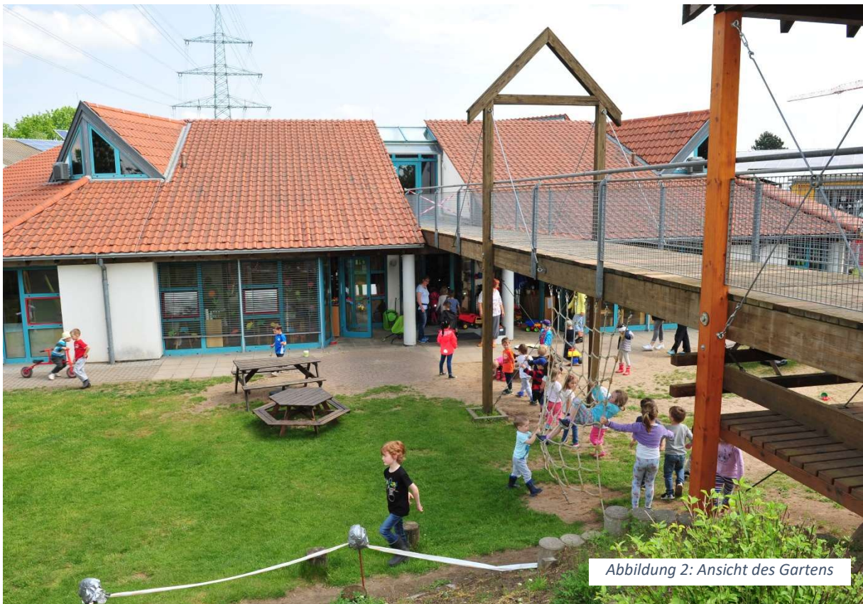
Abbildung 2: Ansicht des Gartens