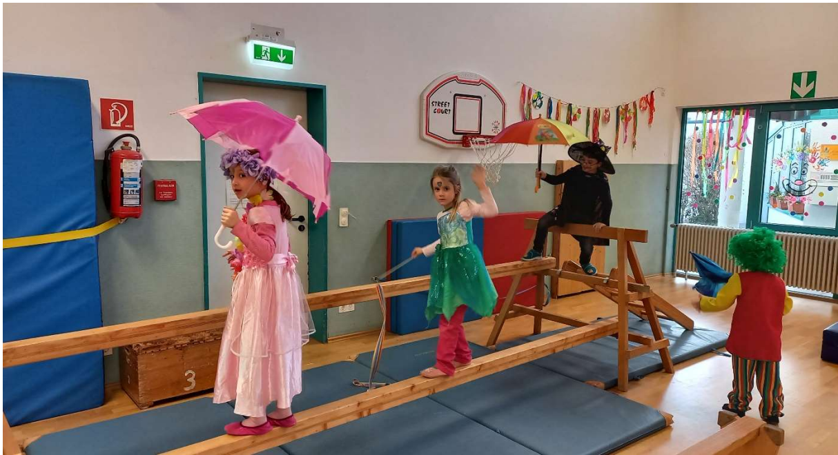
Abbildung 6 Zirkus in der Halle

Bei Fragen oder Anregungen können Sie sich gerne an Frau Krawietz und das Team des Sportkindergartens der SG Weiterstadt 1886 e. V. wenden: